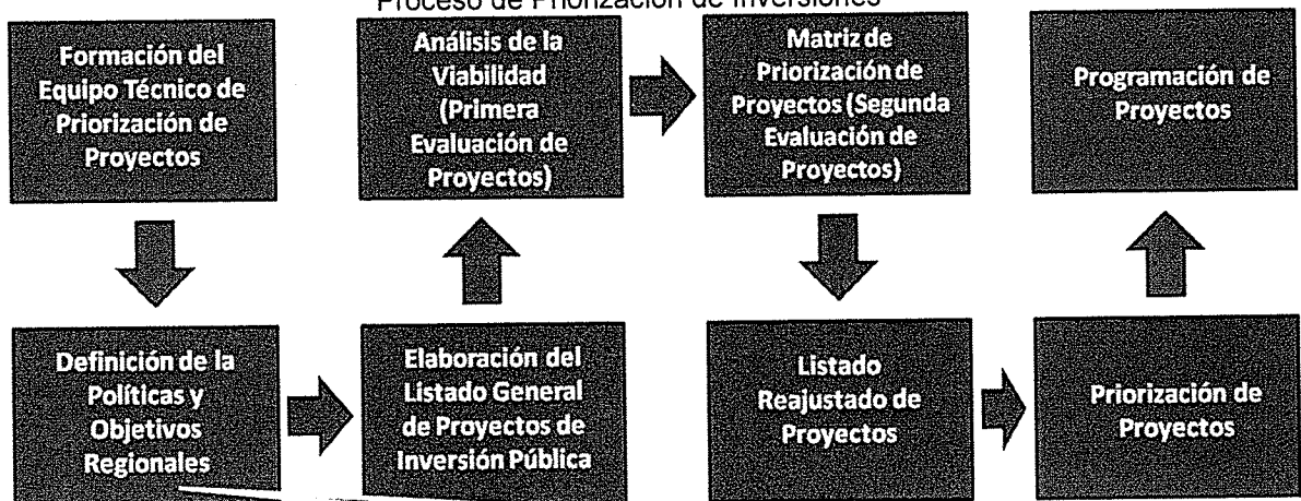
Gráfico N° 2 Proceso de Priorización de Inversiones

Los objetivos regionales ya están definidos en el PDRC, PEI y otros planes regionales